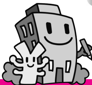
経済センサスキャラクター