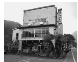
22年度最優秀賞受賞 「レストラン手取川」